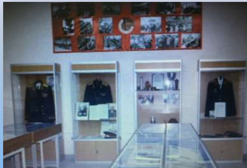
Музей 43 Армии